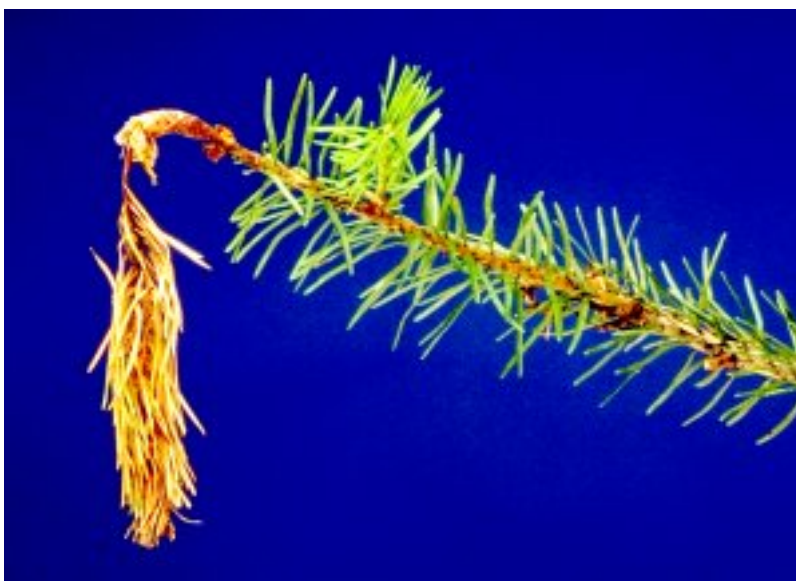
Signe typique d'une attaque de Botrytis sur un jeune épicéa.