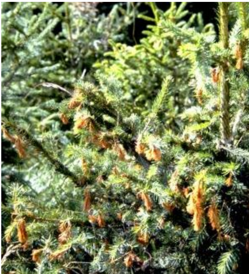
Les rameaux d'épicéa qui viennent d'éclore sont morts et pendent mollement à la branche.