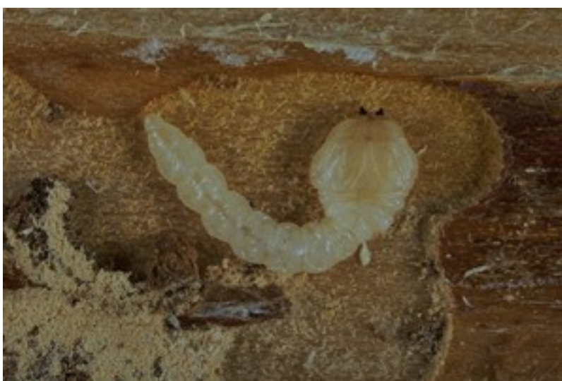
La larve a la forme typique d'une larve de bupreste.