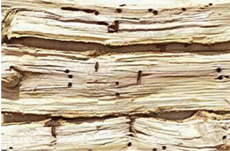
Befall durch den Ungleichen Holzbohrer