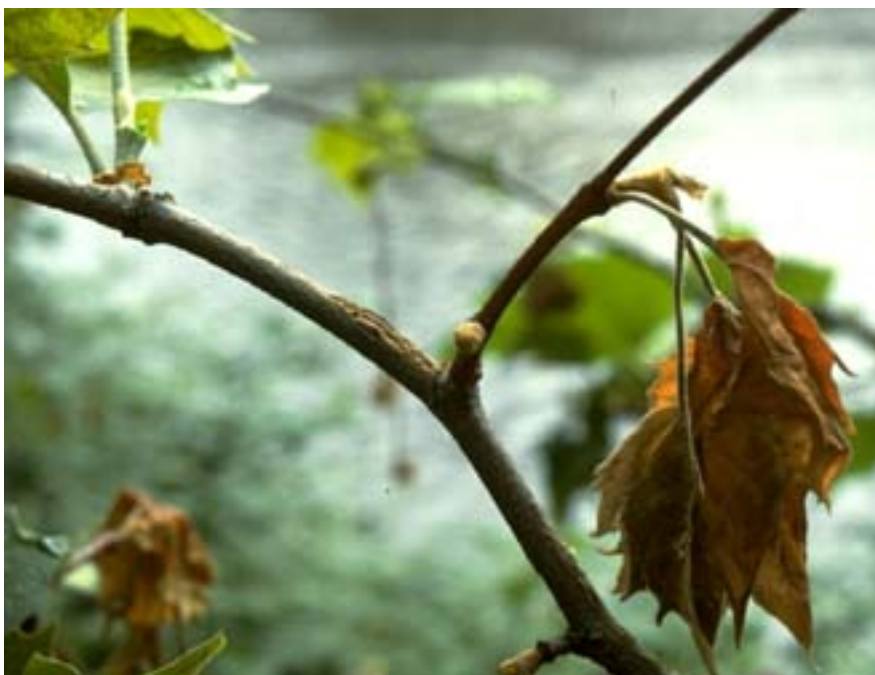
Abb. 2. Braune Blätter und Rindennekrosen verursacht durch die Platanen-Blattbräune.