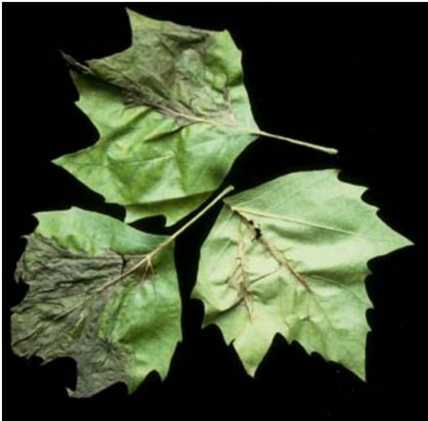
Abb. 1. Platanen-Blätter mit braunen Flecken der Platanen-Blattbräune. Die Flecken entwickeln sich entlang den Blattnerven.